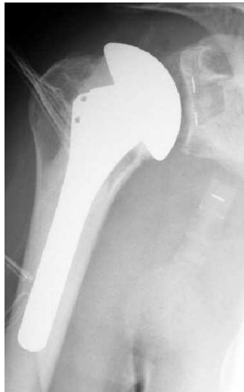
Total-Endoprothese mit Schaft